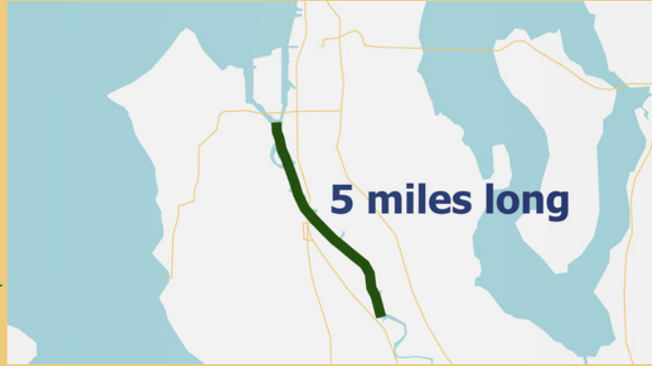
ទីតាំងដែលមានជាតិកខក់នៅតាមចុងផ្លូវទឹកស្ទឹង Duwamish មានចំងាយប្រវែង 5 មាយ។